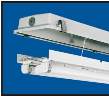
Insatsen hänger vid installation.