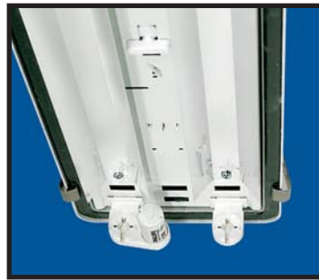
Mamba med reflektor.