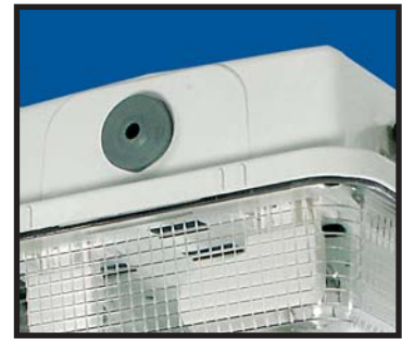
Kabelgenomföring i EPDM material.