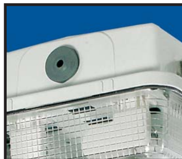
Kabelgenomföring i EPDM material.